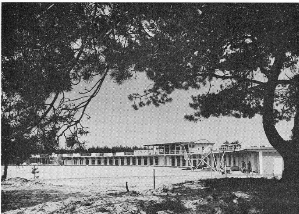
Zilvermeer, Mol, 1958

zal men zelfs blijven vaststellen hoe Schellekens met een sierlijk gemeentehuis het gehele aanschijn van een dorp veranderde.