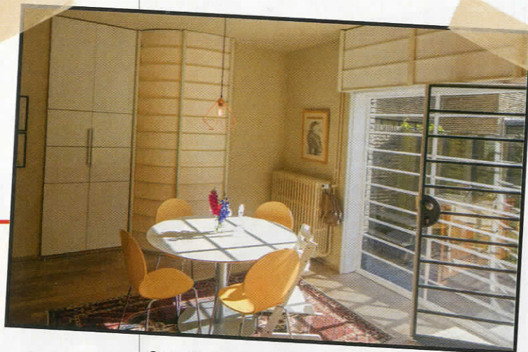
Overall is er enkel glas. Dat moet zo blijven omdat de woning een beschermd monument is.