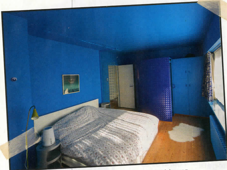
De knalblauwe slaapkamer krijgt later nog een andere kleur.