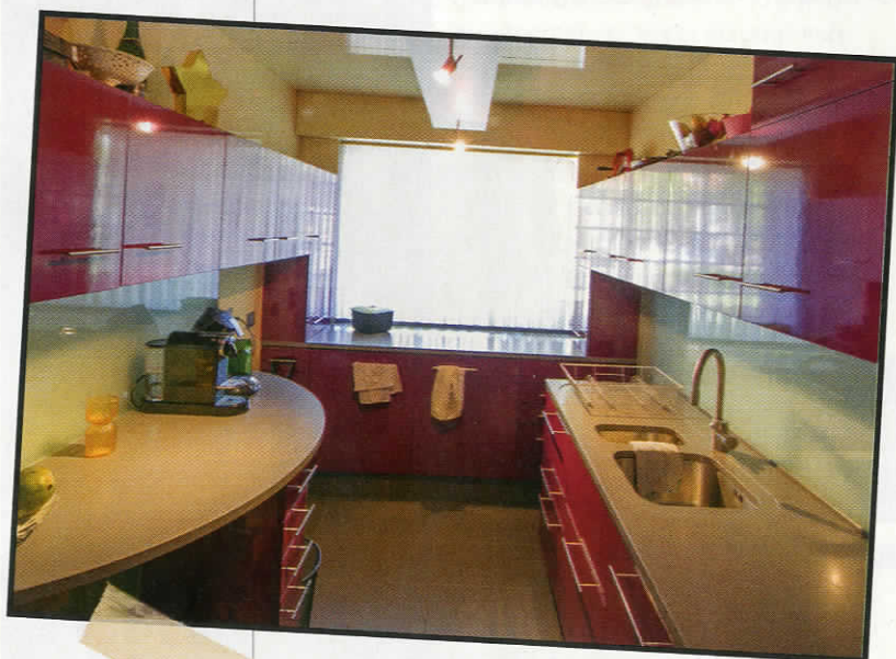
De kleurrijke keuken. Een doorgeefluik verbindt ze met de woonkamer.